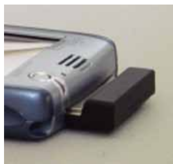
FS Pocket Loox